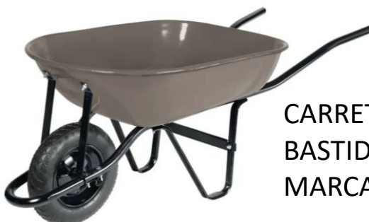
CARRETILLA CON BASTIDOR BIPARTIDO MARCA PRETUL