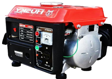
PLANTA DE LUZ HUSKY O BURCAT POWER 900W