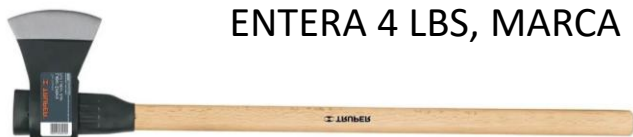
HACHA MANGO ENCINO, LABOR ENTERA 4 LBS, MARCA PRETUL