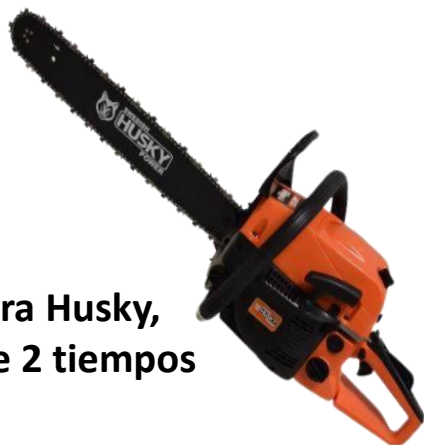
Motosierra Husky, 52 cc y de 2 tiempos