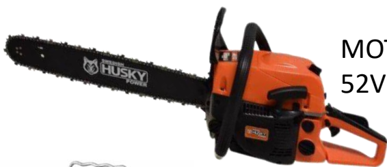
MOTOSIERRA HUSKY 52VCC 2 TIEMPOS