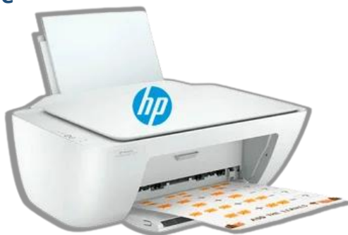
Impresora HP Multifuncional, scanner a color