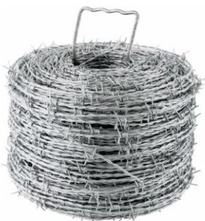
ALAMBRE DE PUAS 34 KG/12.5 CALIBRE 340 MTS