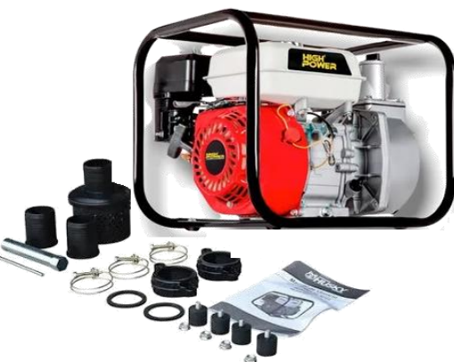
Bomba de agua 6.5 HP, con entrada y salida de 2" con accesorios y aditamentos (Husky)